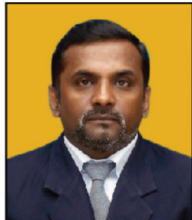
Eng. K.A. ජානක සාමාන්‍යාධිකාරී ජාතික නිවාස සංවර්ධන අධිකාරිය