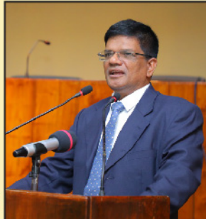
Eng. R.H. රුවේනිස් සභාපති ඉදිකිරීම් කර්මාන්ත සංවර්ධන අධිකාරිය