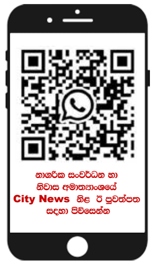
නාගරික සංවර්ධන හා නිවාස අමාත්‍යාංශයේ City News නිළ ඊ පුවත්පත සඳහා පිවිසෙන්න

අමාත්‍යවරයා සඳහන් කළේ පාසල්වල ඇති අඩක් නිම කළ ගොඩනැගිලි රාශියක් තිබෙන බවයි. තිබෙන ආර්ථික පහසුකම් අනුව මේ ගොඩනැගිලි පිලිසකර කරන්න බලාපොරොත්තු වෙන බවද ඔහු කීය.