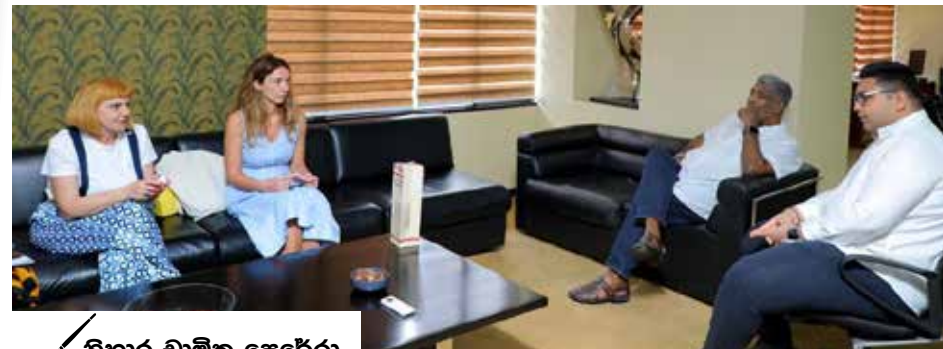
හිභාර වාමික පෙරේරා