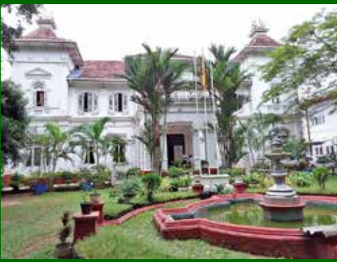
නව දිස්ත්‍රික් කාර්යාල ගොඩනැගිල්ල